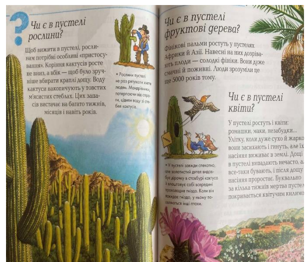
Мал. 6. «Ілюстрації»

Кегель шрифту текстівок рекомендується не