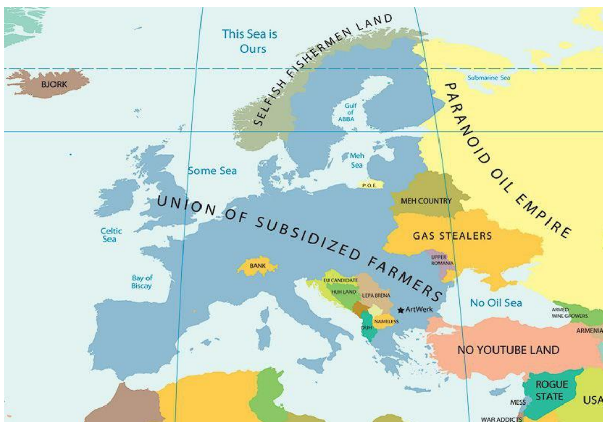
Рисунок 1. Карта з «Атлас стереотипів та упереджень»

Болгарський художник Янко Цветков зобразив серію карт світу, що відображають різноманітні національні стереотипи. До створення даних ілюстрацій його спонукали ситуації, коли він намагався пояснити специфіку менталітету різних народів своїм іноземним друзям. Пізніше на основі цих ілюстрацій він створив «Атлас стереотипів та упереджень».