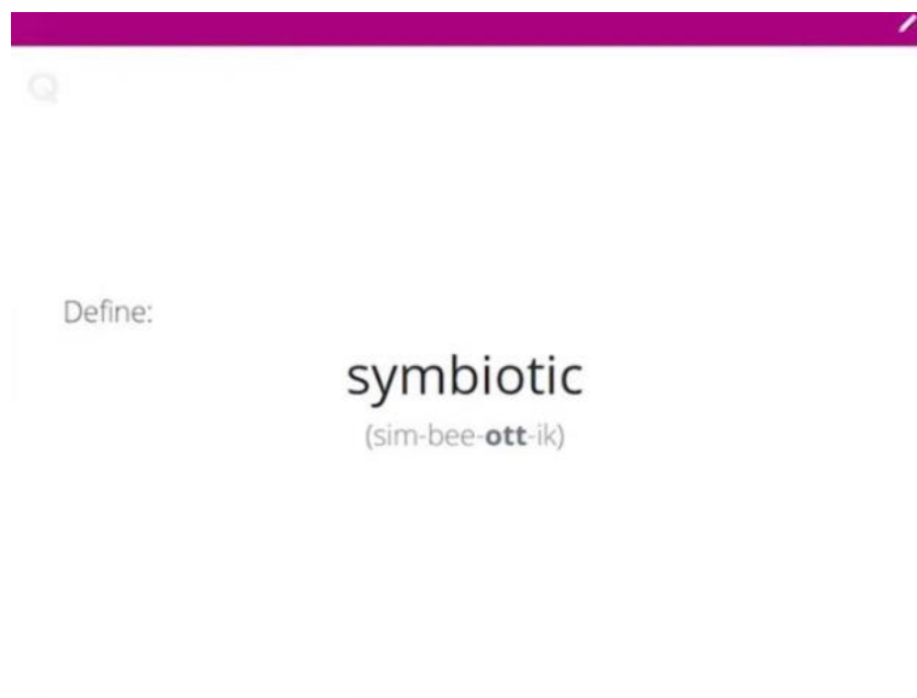
Рисунок 3. Brainscape Flashcards

Brainscape Flashcards is a flashcard platform for Android and iOS that allows users to create their own digital flashcards and view ready-made collections created by other students and teachers. The app contains many flashcards on various topics, including languages, literature, history, science, math, and more.