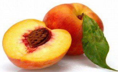
Рисунок 1. Quizlet