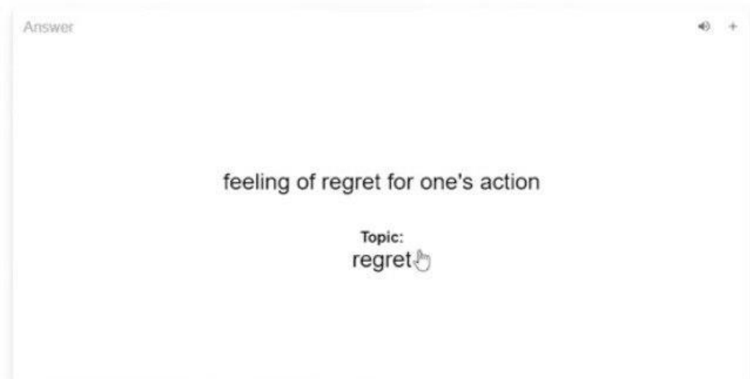
Рисунок 2. The Flashcard Lab

The Flashcard Lab is an app that helps to study anything from graduate entrance exams to new languages. It includes a randomized review of flashcards, the studying with spaced repetition mode and allows you to add synonyms, mnemonics, etc. Furthermore, printable flashcards by using lists in Google Sheets can be created: