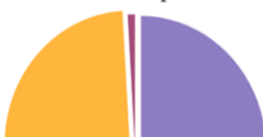
Способи перекладу стилістичних фігур у вітальних промовах Володимира Зеленського